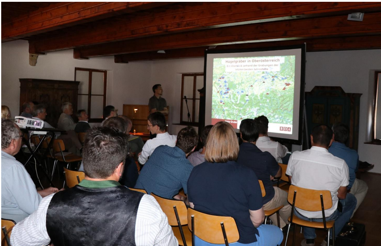
Vortrag von H. Gruber über vorgeschichtliche Grabhügel in Oberösterreich.