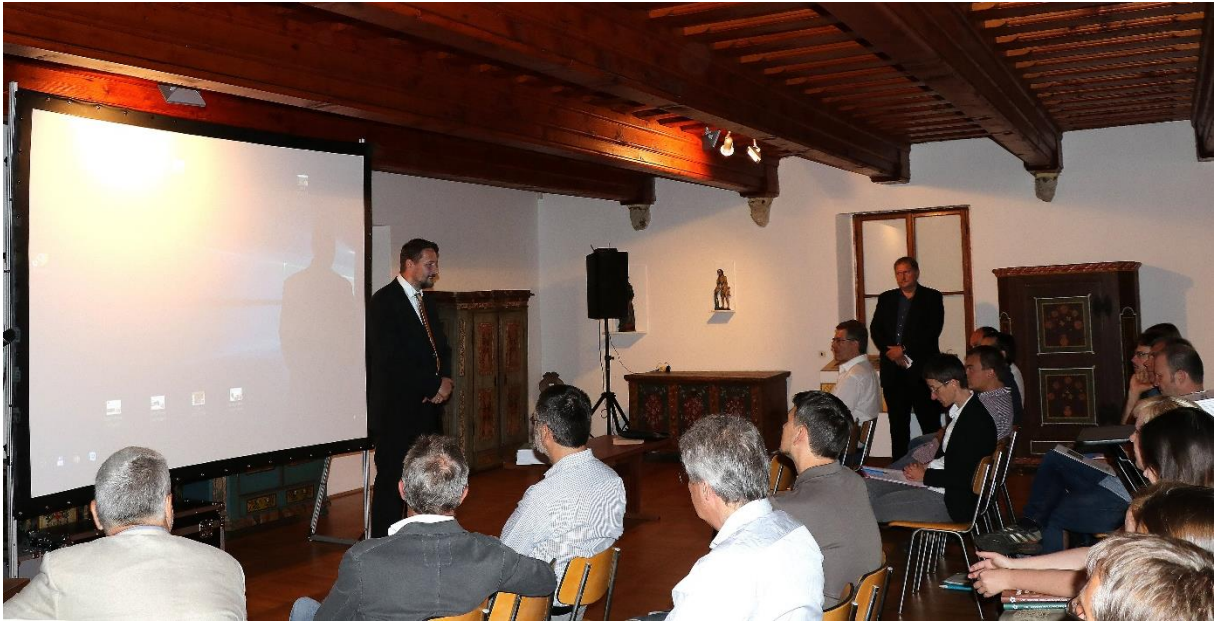
Eröffnung der Tagung: Begrüßung vom Dekan der Philosophischen Fakultät der Südböhmischen Universität.