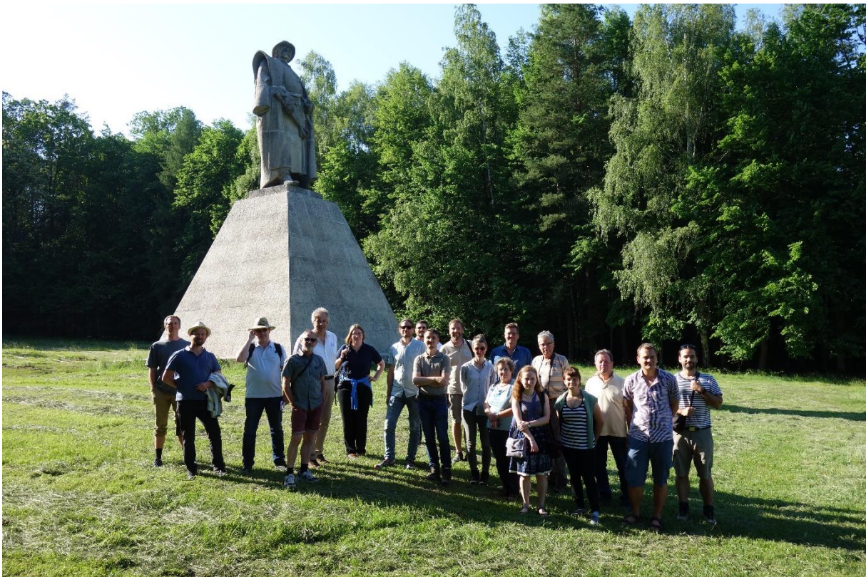
Exkursion an den Žižka-Geburtsort in Trocnov.