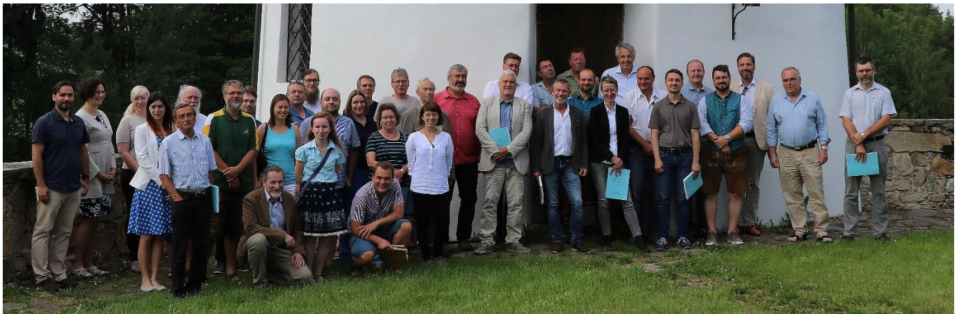
Gemeinsames Gruppenfoto aller Teilnehmer in Žumberk.