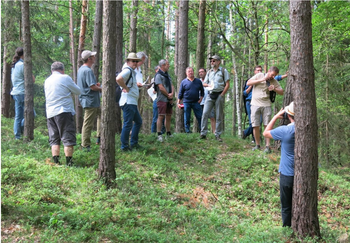
Exkursion zum Hügelgräberfeld in Plav.