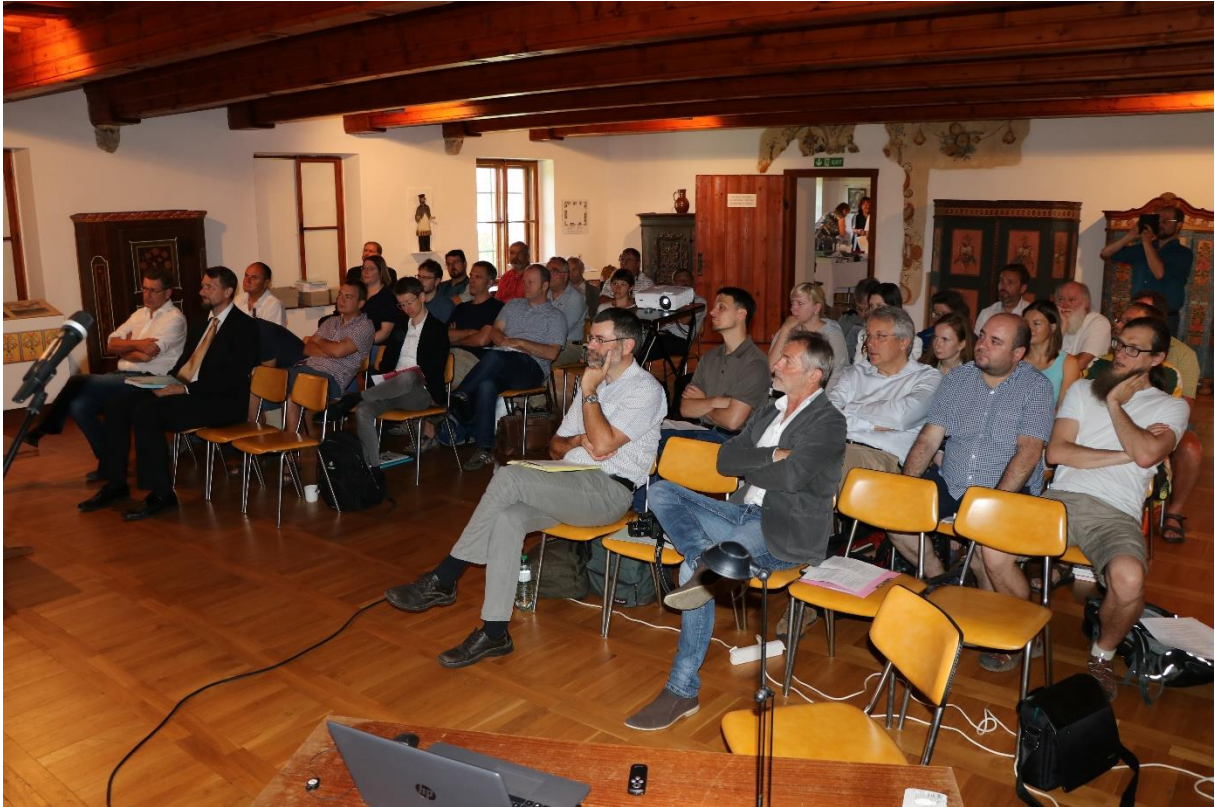
Blick in den Tagungssaal.