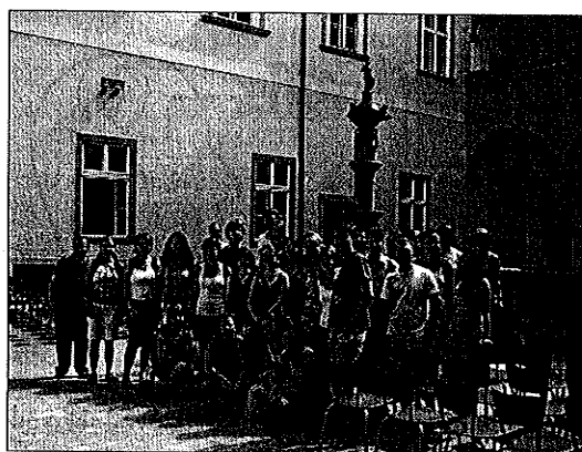
Účastníci Letního kolegia na nádvoří Zemského domu (Landhaus) v Linci

maier, která hovořila o úskalích uměleckého překladu obecně i na základě konkrétních příkladů. Mezi autory, které překládá, patří Jan Neruda, ze současných např. Petra Hůlová či Jiří Kratochvíl. Už podruhé mezi nás zavítal rakouský spisovatel a nově i překladatel Michael Stavaric, autor s českými kořeny. Kromě úryvků ze své dřívější knihy „Europa: Eine Litanei“ nám četl i dosud nezveřejněné texty pro dospělé i děti a na našich reakcích si mohl ověřit, jak by mohly fungovat v hotové knize. Do třetice nás navštívil zástupce mladé české literatury Jaroslav Rudiš, kterého proslavily knihy Nebe pod Berlínem a Grandhotel. Posledně jmenovaná se dočkala i filmové podoby. Vždy po skončení autorských čtení měli studenti možnost hovořit s autory neformálně i mimo prostory posluchárny. V diskusích je tak měli možnost poznat i jako velmi příjemné společníky a zajímavé osobnosti.