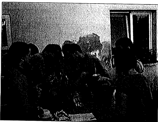
Studenti Letní rybářské školy při praktických cvičeních

Ve dnech 7. – 28. 7. 2010 uspořádala Fakulta rybářství a ochrany vod Jihočeské univerzity již třetí ročník úspěšné letní rybářské školy. Přihlásilo se celkem 11 zájemců, z toho bylo 9 studentů z vysokých škol a 2 studenti ze středních škol. Stejně jako v loňském roce pracovali studenti u svých „školitelů“ na malém výzkumném projektu a dopoledne či v podvečer se účastnili teoretických přednášek a praktických ukázek. Součástí letošní letní školy byla i exkurze na Pstruhařství Mlýny poblíž Vacova na Šumavě.