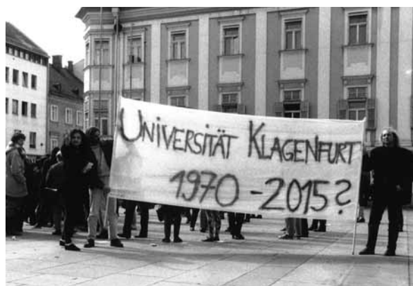
Protestkundgebung 1992 auf dem Neuen Platz in Klagenfurt

Die Fragen stellte für UNIsone Lydia Krömer.