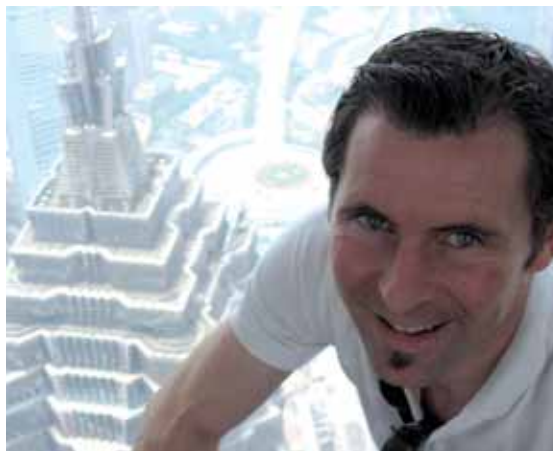
Projekteinsatz in Shanghai

Und privat: „Meine beiden Kinder bilden für mich den besten Ausgleich zum beruflichen Alltag“, bringt er es auf einen kurzen Nenner.