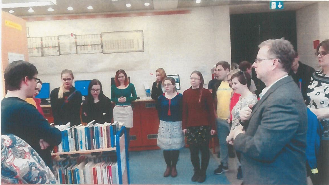
Fotos von der Veranstaltung: Besuch der Uni Wien mit germanistischer Bibliothek, auf der ÖDaF-Tagung, Nachbereitung und Plakaterstellung