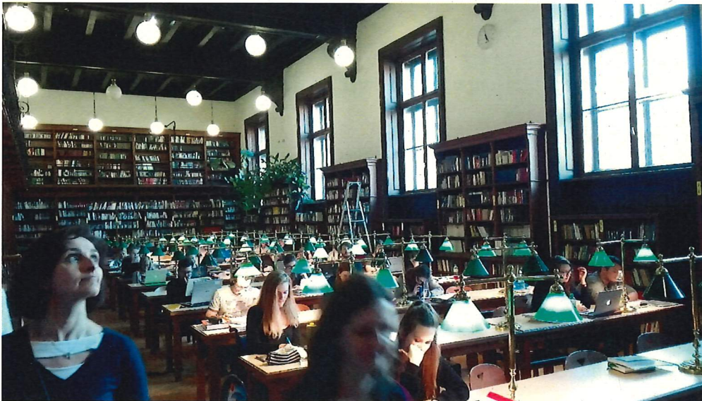
Lesesaal der Hauptuniversität