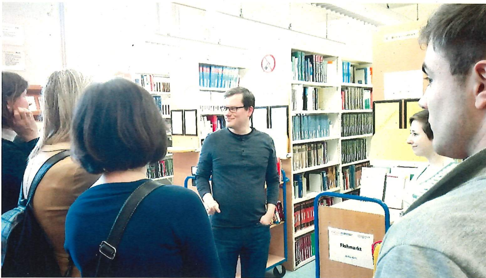
Führung durch die Bibliothek der Germanistik Wien