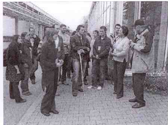
Führung bei BMW