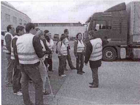
Führung bei Fa. MAN Steyr AG

Studierende der Fachrichtung Handelswissenschaften und Global Sales Management im Fach „Internationales Marketing“ (Siehe Präsenzlisten)