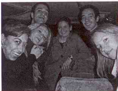
Anreise der Studierenden aus Steyr mit dem Bus

Studierende der Managementfakultät Steyr